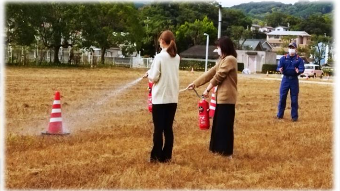
実際に消火器を使って 火元に水を当てる訓練を行いました